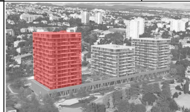
POLOŽAJ ZGRADE U SKLOPU KOMPLEKSA: