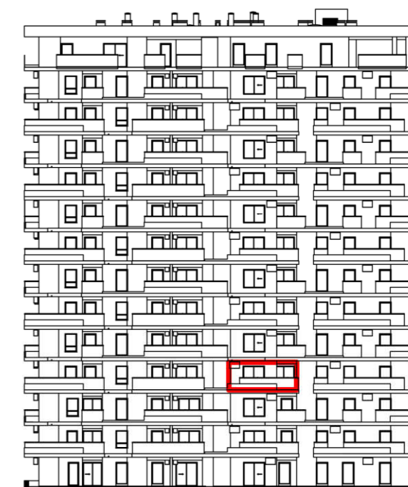
POLOŽAJ U ZGRADI - PROČELJE: