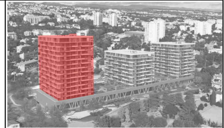
POLOŽAJ ZGRADE U SKLOPU KOMPLEKSA:

NAPOMENA: Katalog stanova je informativnog karaktera te su moguća eventualna odstupanja