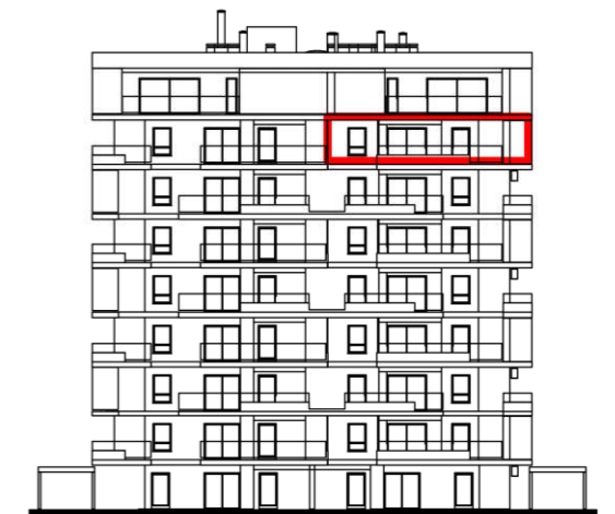
POLOŽAJ U ZGRADI - PROČELJE: