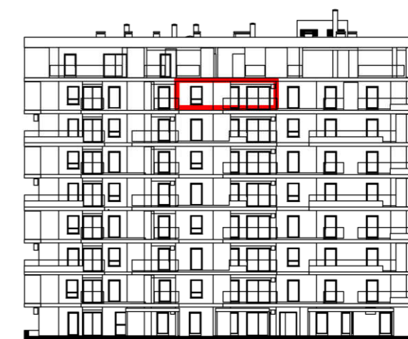
POLOŽAJ U ZGRADI - PROČELJE: