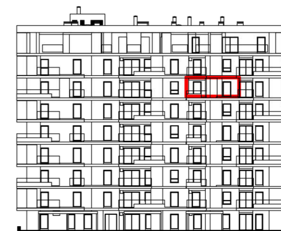
POLOŽAJ U ZGRADI - PROČELJE: