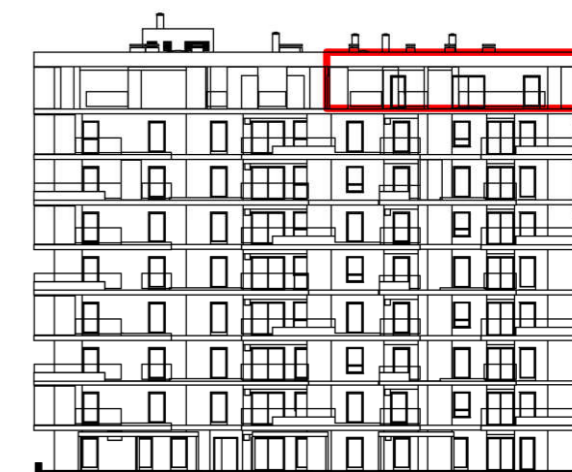
POLOŽAJ U ZGRADI - PROČELJE: