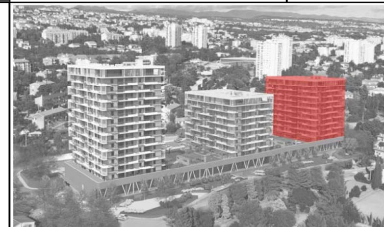
POLOŽAJ ZGRADE U SKLOPU KOMPLEKSA: