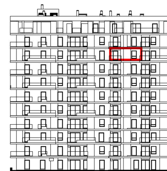
POLOŽAJ U ZGRADI - PROČELJE: