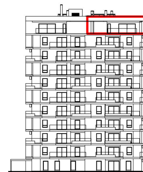
POLOŽAJ U ZGRADI - PROČELJE: