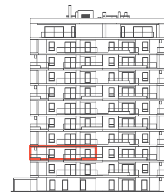
POLOŽAJ U ZGRADI - PROČELJE: