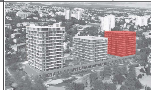
POLOŽAJ ZGRADE U SKLOPU KOMPLEKSA: